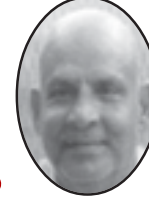
स्वामी शिवानंद सरस्वती