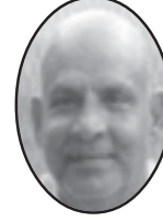
स्वामी शिवानंद सरस्वती